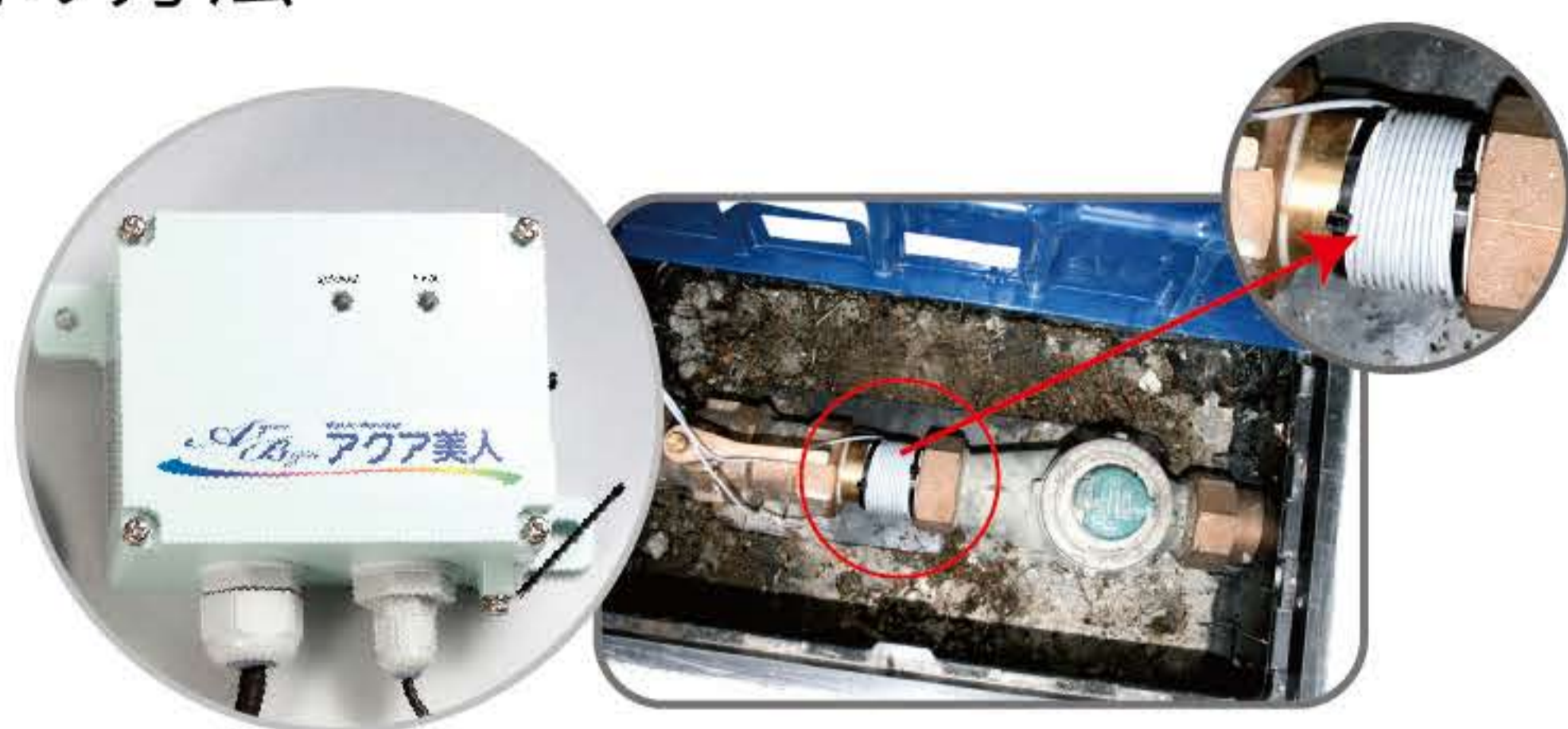
給水装置にケーブルを巻くだけ